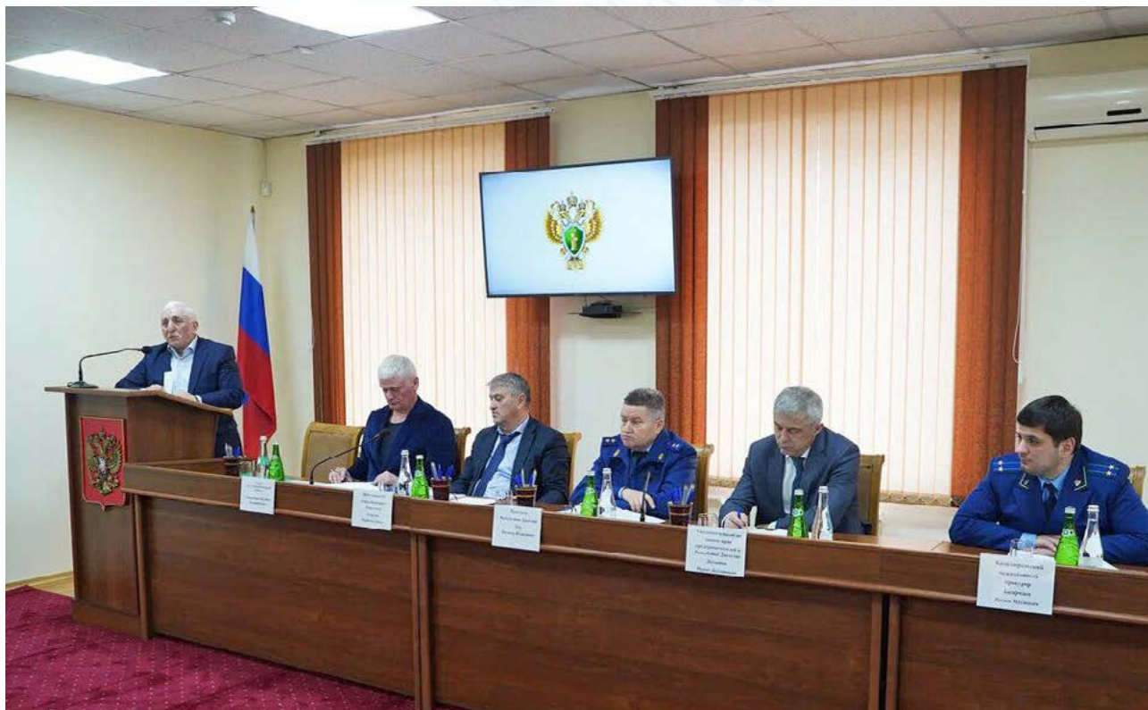
Бизнес-омбудсмен Дагестана совместно с прокурором республики провели прием предпринимателей в Кизилюрте