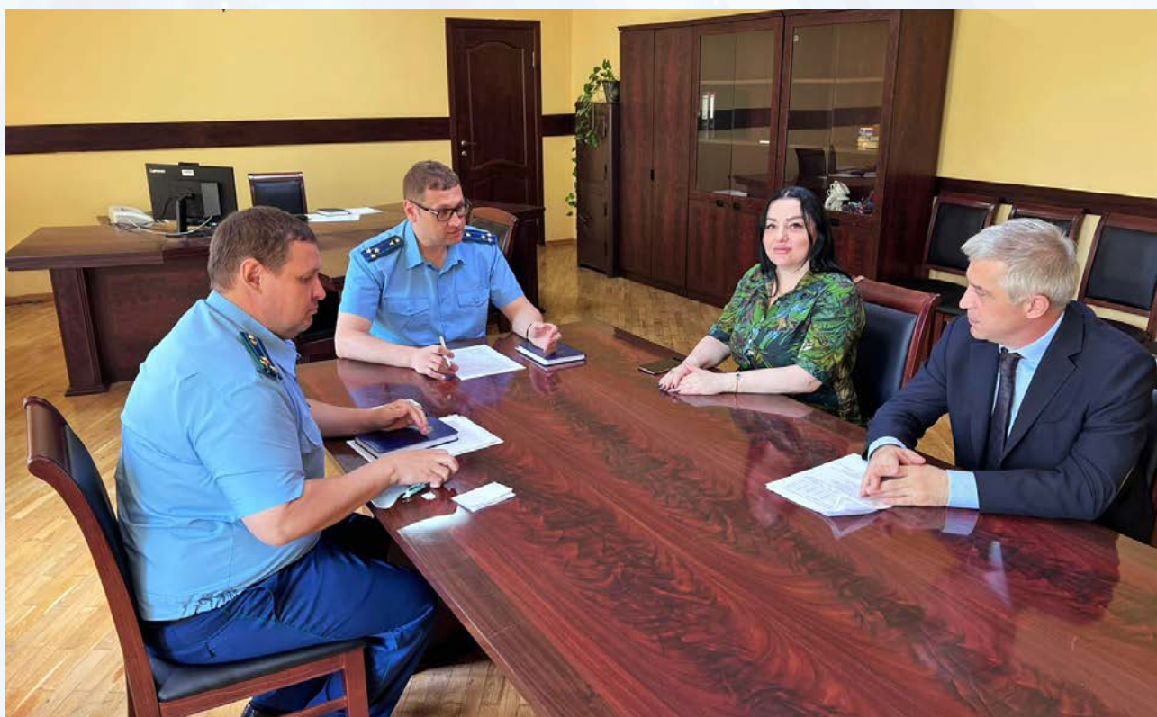
Уполномоченный по защите прав предпринимателей в Республике Дагестан принял участие во встрече с природоохранными прокурорами