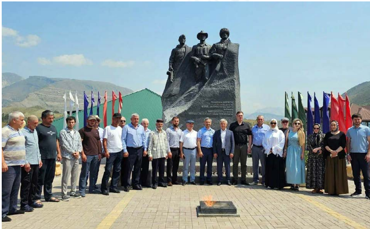
Уполномоченный по защите прав предпринимателей принял участие в муниципальном экономическом форуме в Ботлихе