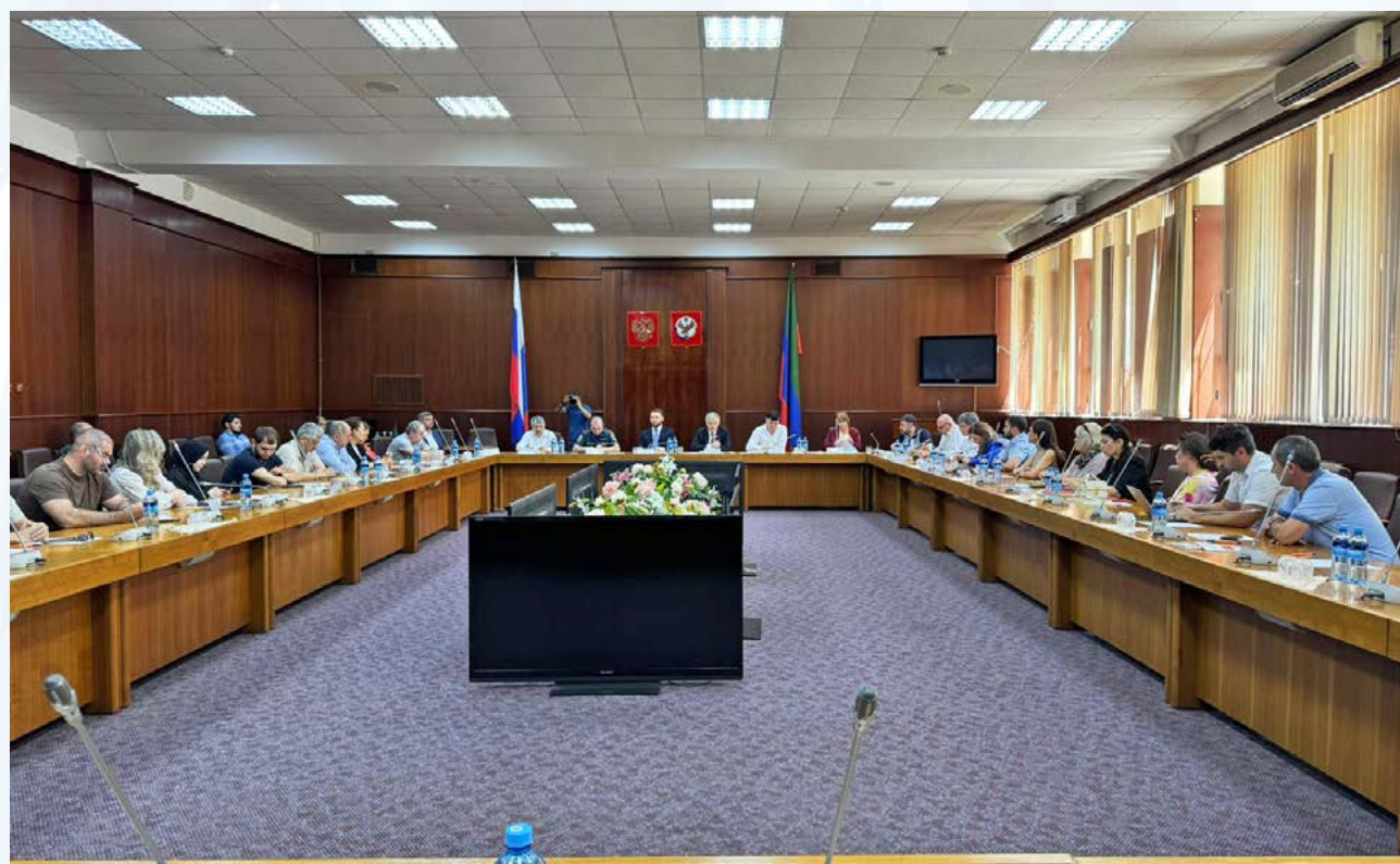
Образовательное мероприятие для бизнеса в сфере общественного питания