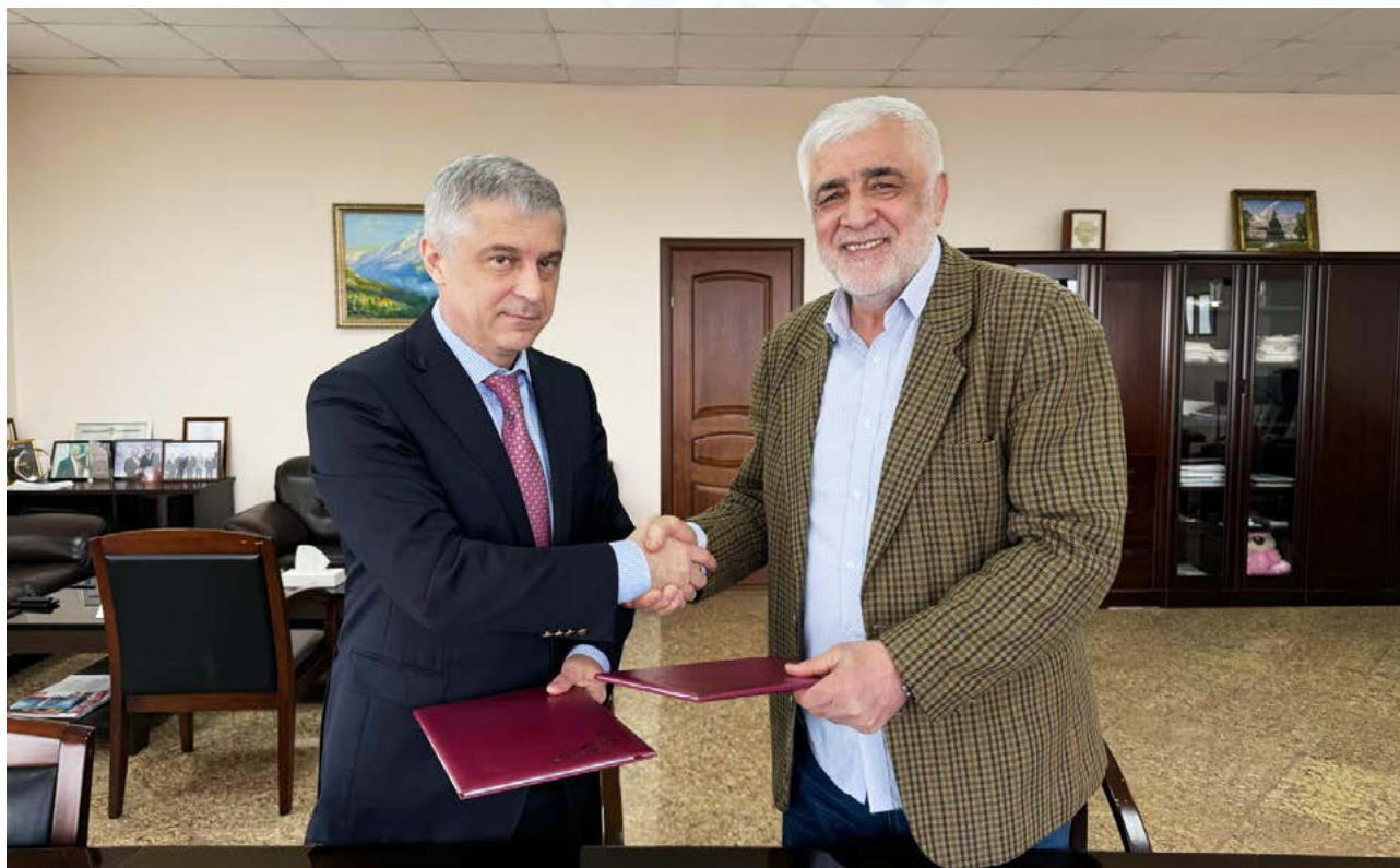
Заключение соглашения о сотрудничестве с Ассоциацией «Народный фермер Республики Дагестан»