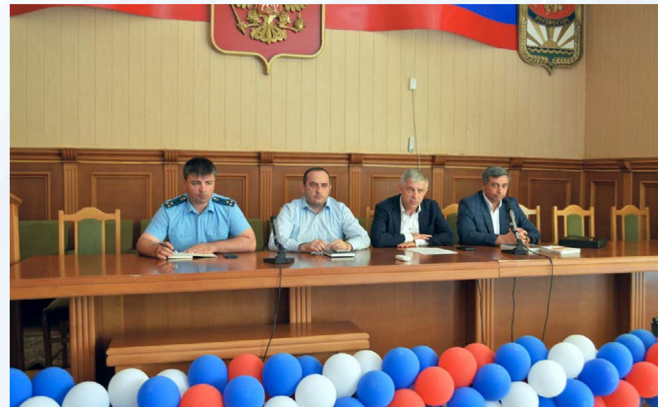
Встреча с предпринимателями Каякентского района