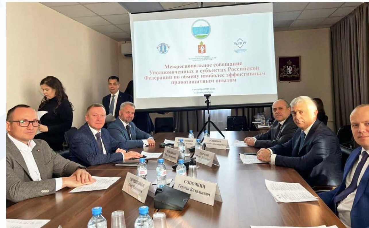
Бизнес-омбудсмен Дагестана принял участие в XVII Всероссийском форуме «Юридическая неделя на Урале»