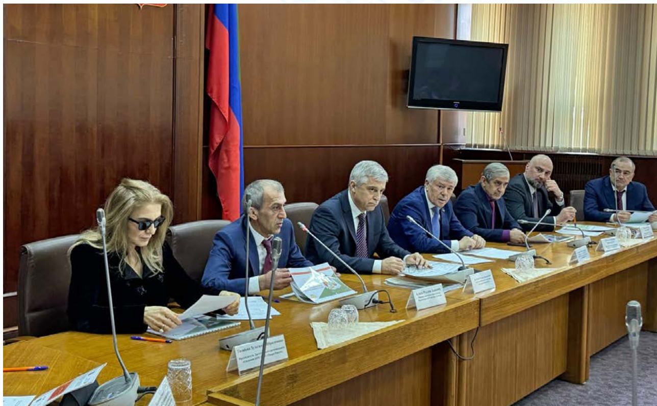
Круглый стол для обсуждения проекта доклада Уполномоченного по защите прав предпринимателей в Республике Дагестан за 2024 год