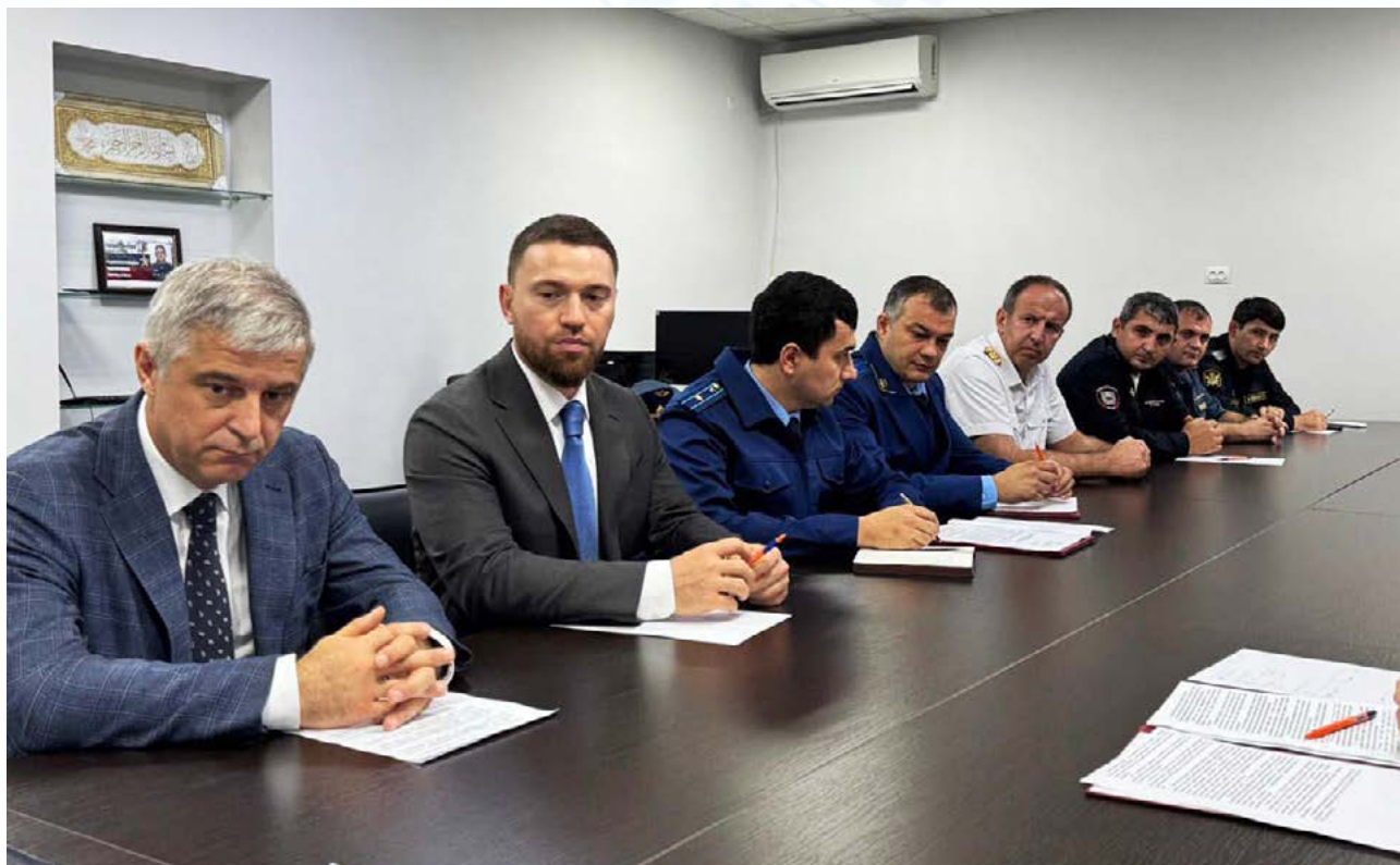
Состоялась встреча с предпринимателями Южно-Сухокумска