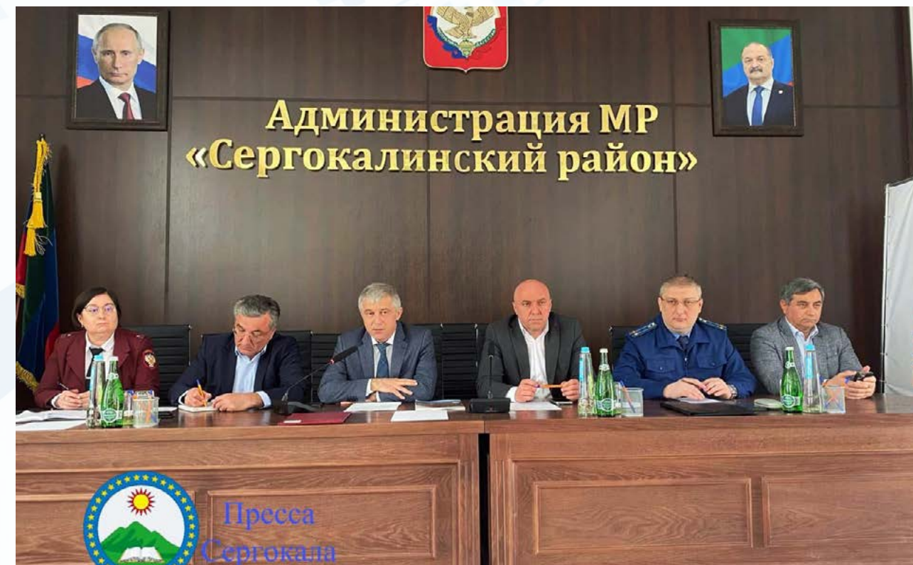
В Сергокалинском районе обсудили защиту прав предпринимателей и меры поддержки бизнеса