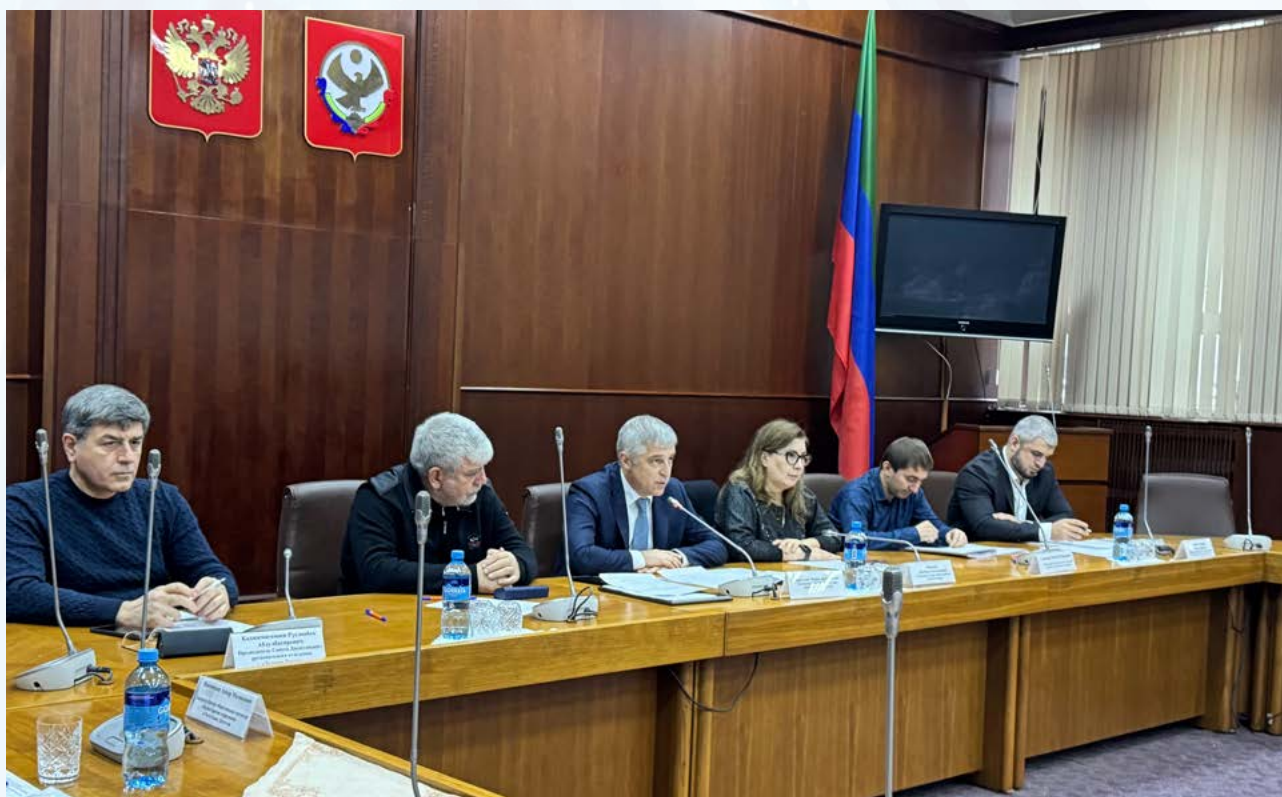
Круглый стол «Налоговая реформа 2026 года основные изменения для бизнеса»