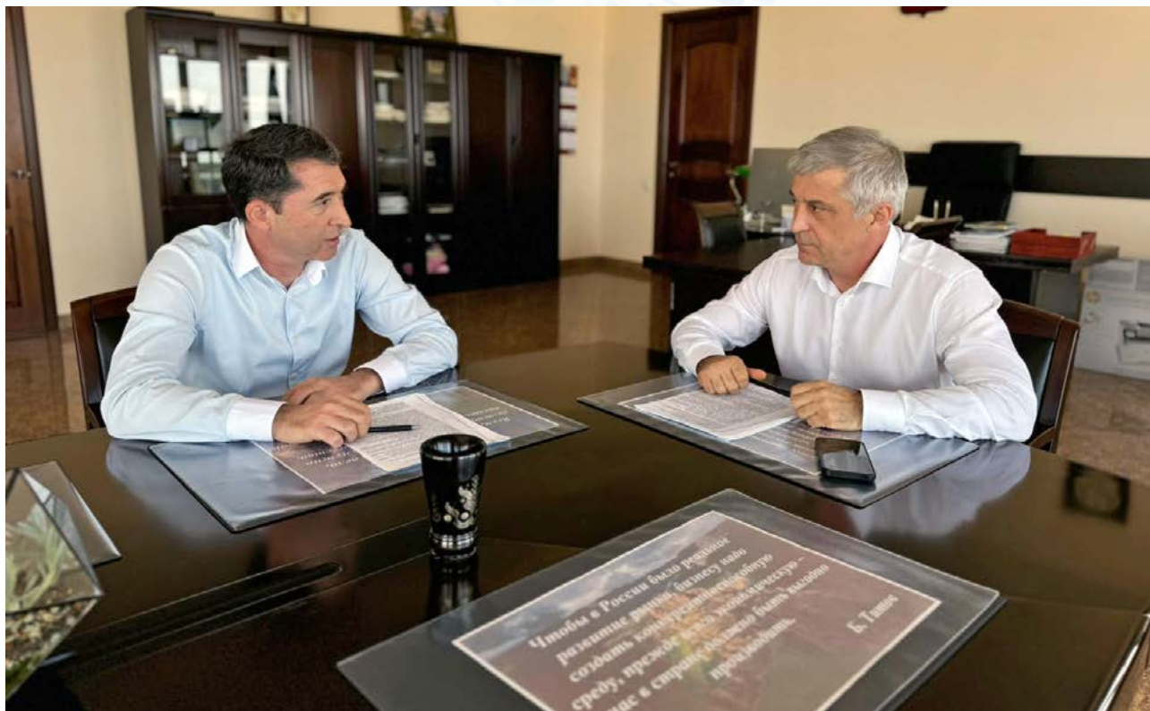
Рабочая встреча с предпринимателем