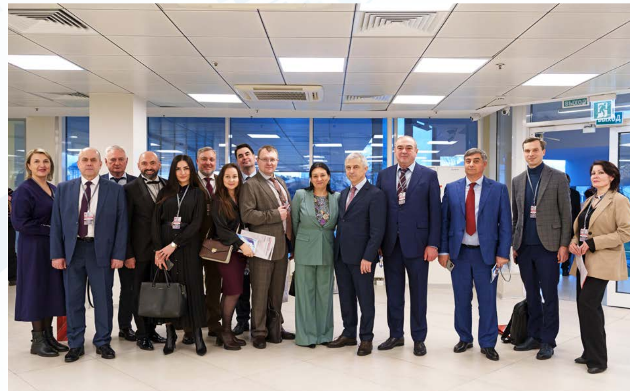
Мурад Далгатов посетил V юбилейный Форум бизнес-омбудсмена Москвы