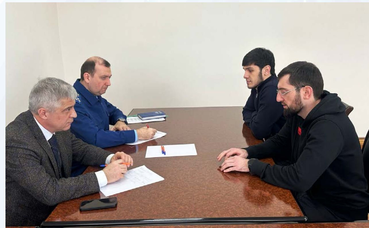
Совместный прием граждан с Дербентским межрайонным природоохранным прокурором