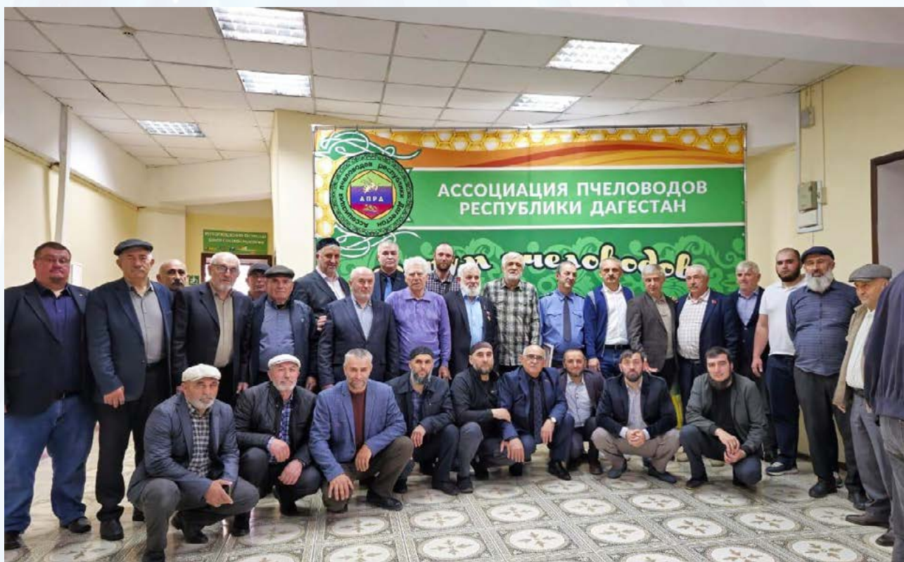
В Махачкале состоялся Форум пчеловодов Дагестана