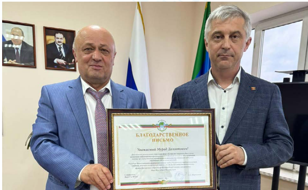
Уполномоченному вручено благодарственное письмо от социального фонда «Все вместе»