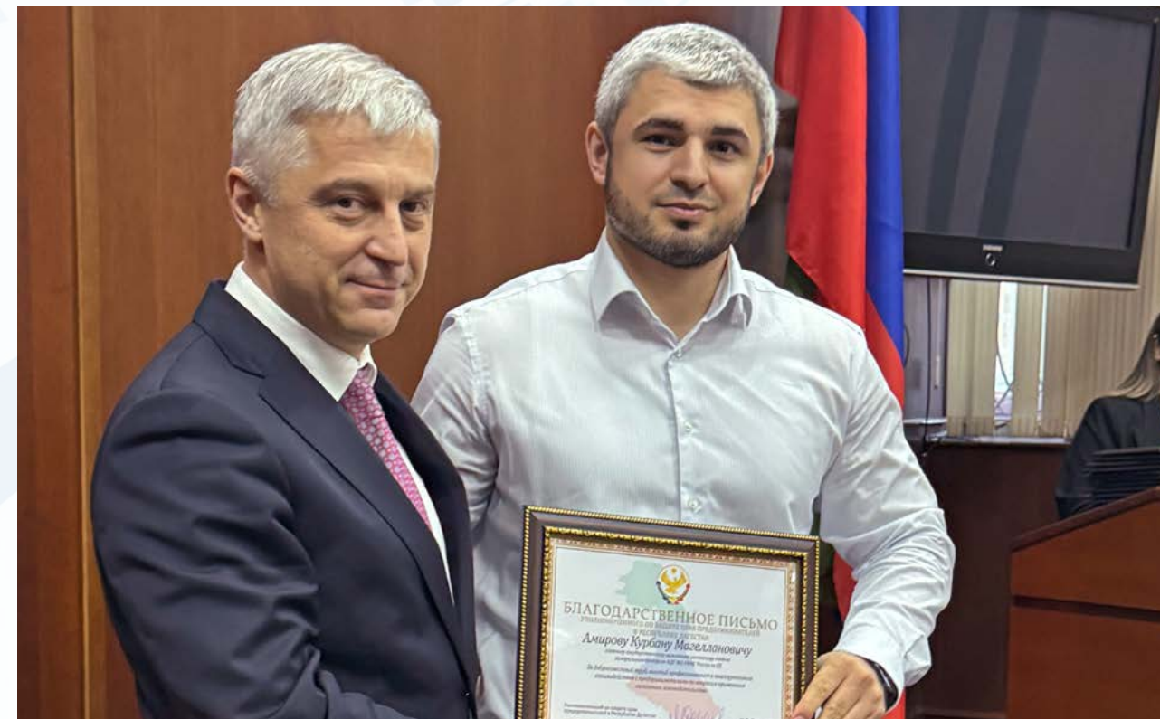
Церемония вручения благодарственных писем по итогам работы за 2025 год