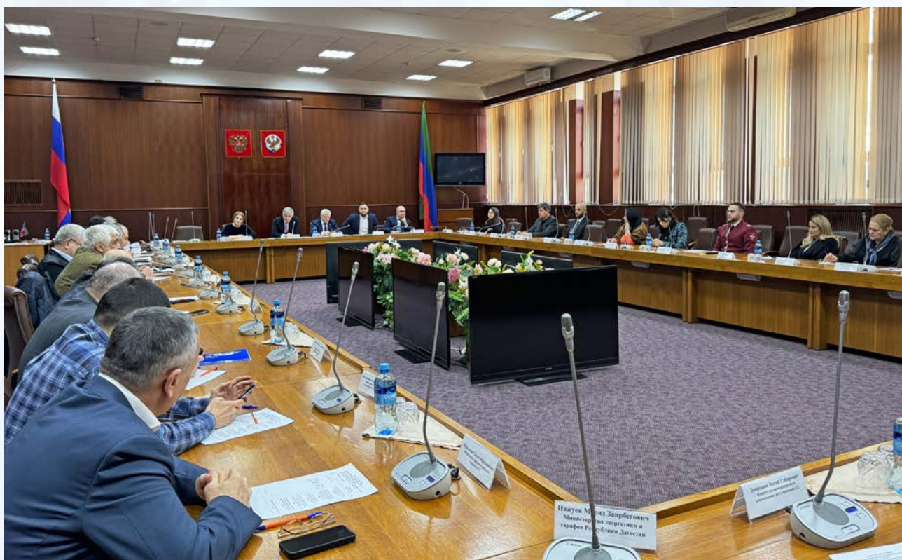
Круглый стол, посвящённый вопросам проведения проверок бизнеса в 2026 году