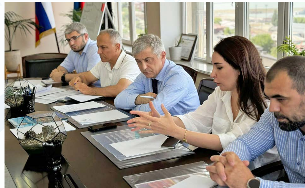
Рабочее совещание с сельхозпроизводителями по актуальным вопросам