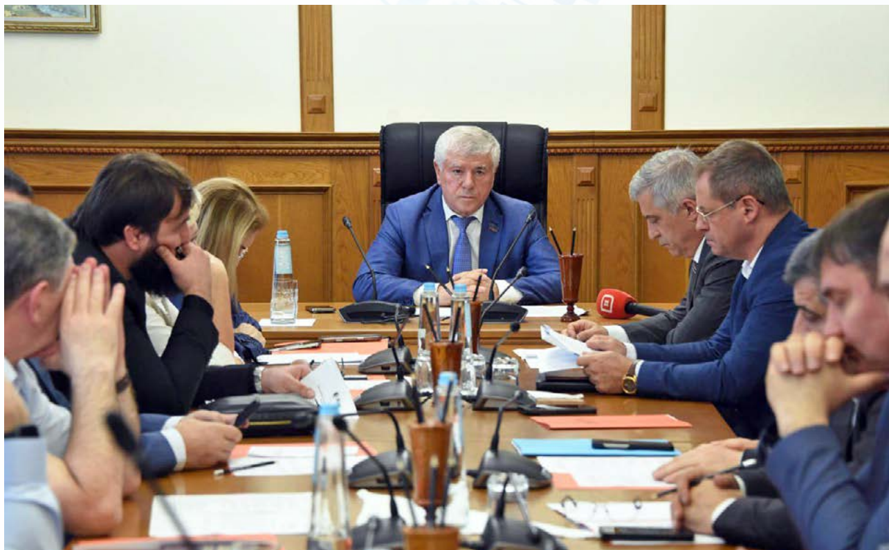
В Народном Собрании обсудили вопросы регулирования рекламы в Дагестане