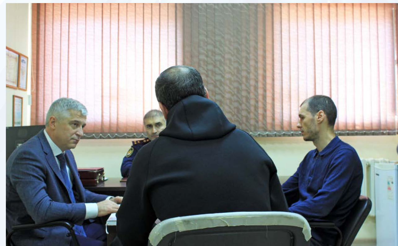
Бизнес-омбудсмен Дагестана посетил в СИЗО № 1 подозреваемых в экономических преступлениях