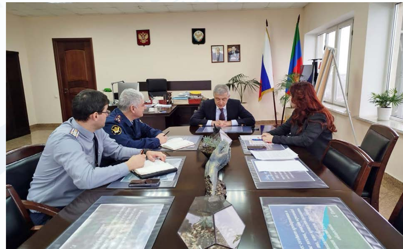
В аппарате Уполномоченного прошла рабочая встреча по вопросам осужденных