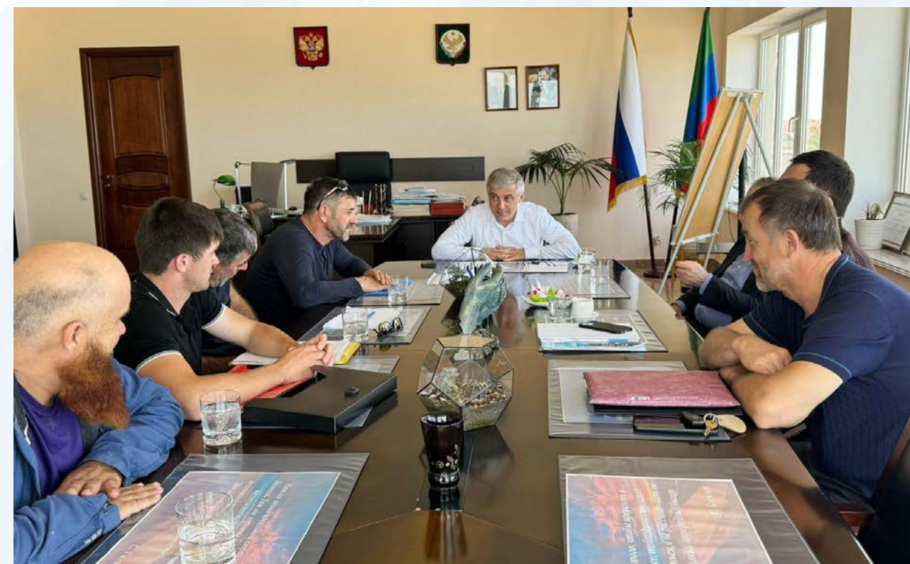
Рабочая встреча с владельцами маломерных судов на Сулакском каньоне