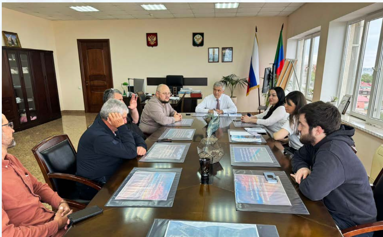
Рабочая встреча с представителями туристической отрасли