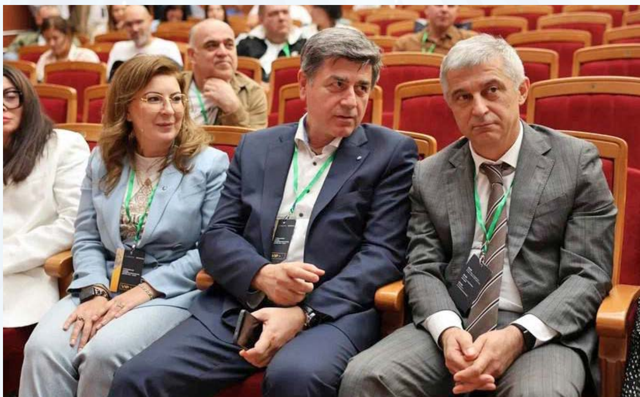
Уполномоченный по защите прав предпринимателей в Дагестане принял участие в «Глобальном съезде предпринимателей»