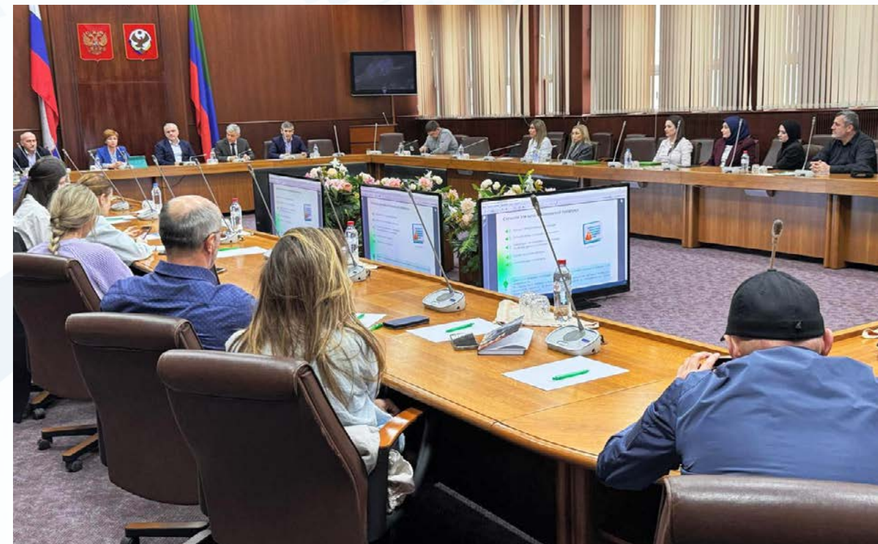
Круглый стол «Бизнес без блокировок по 115-ФЗ»