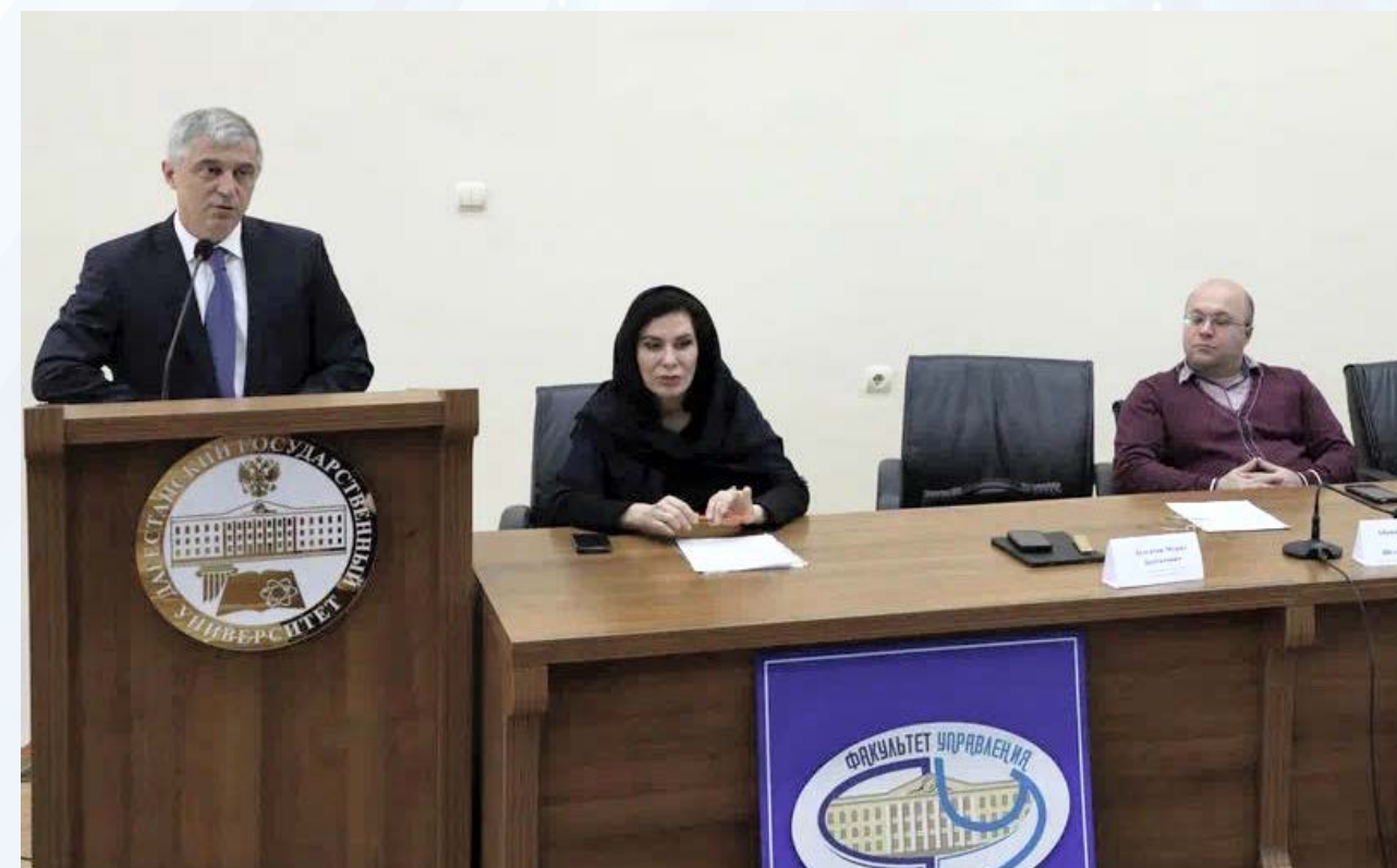
Круглый стол «Перспективы развития предпринимательства в РД» в Дагестанском госуниверситете