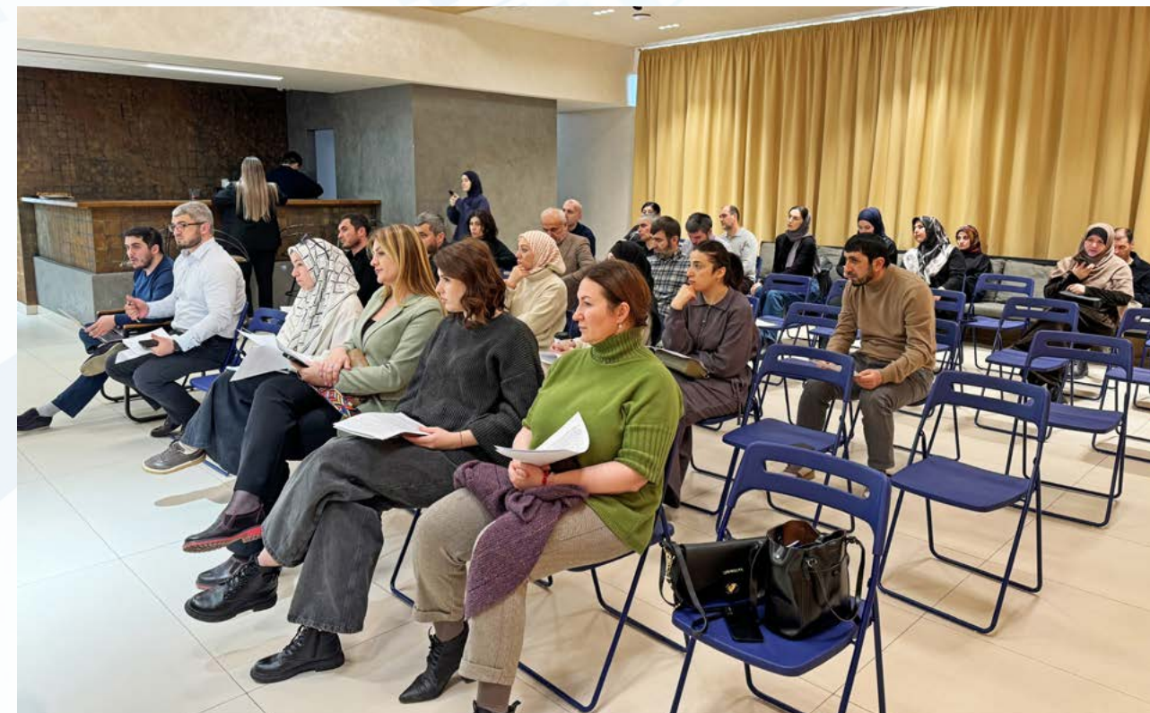
Предпринимателям Дагестана разъяснили изменения налоговой реформы 2026 года