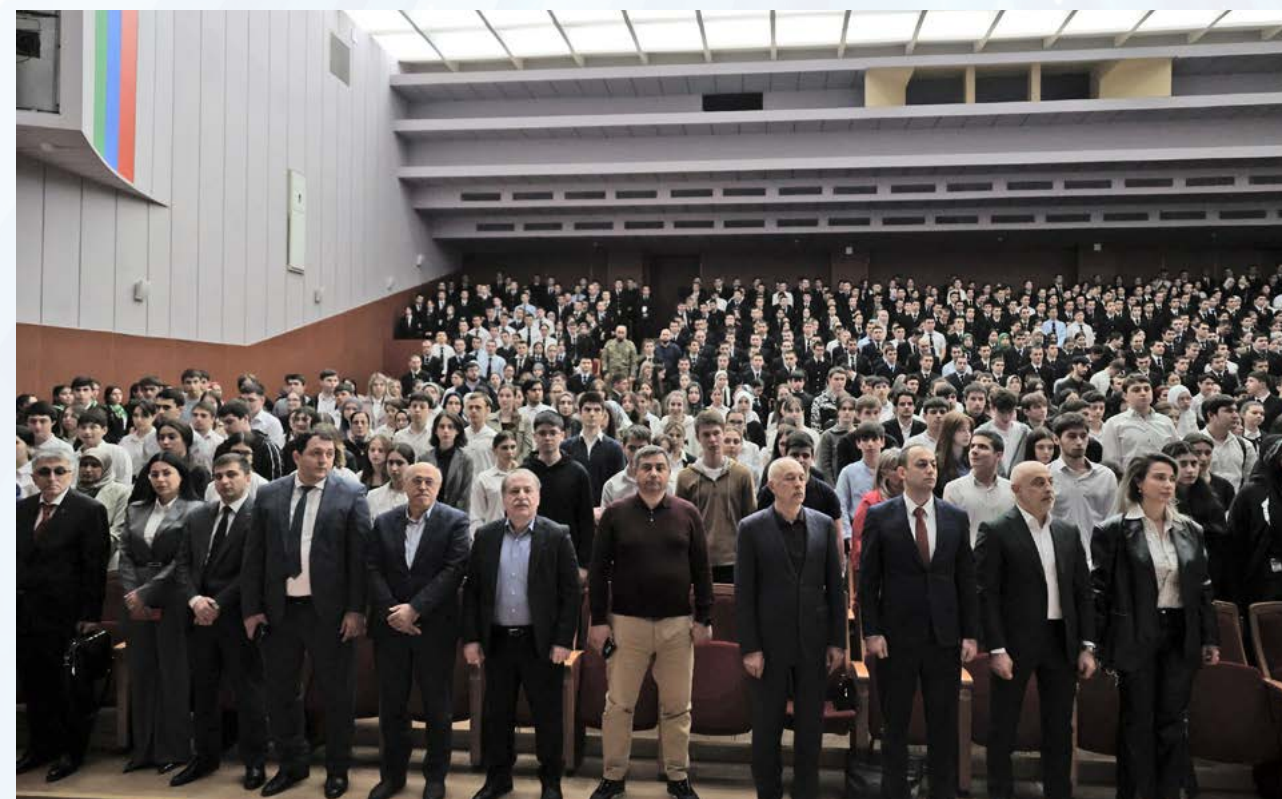
VI Всероссийский слет молодых юристов «Эволюция юриспруденции»