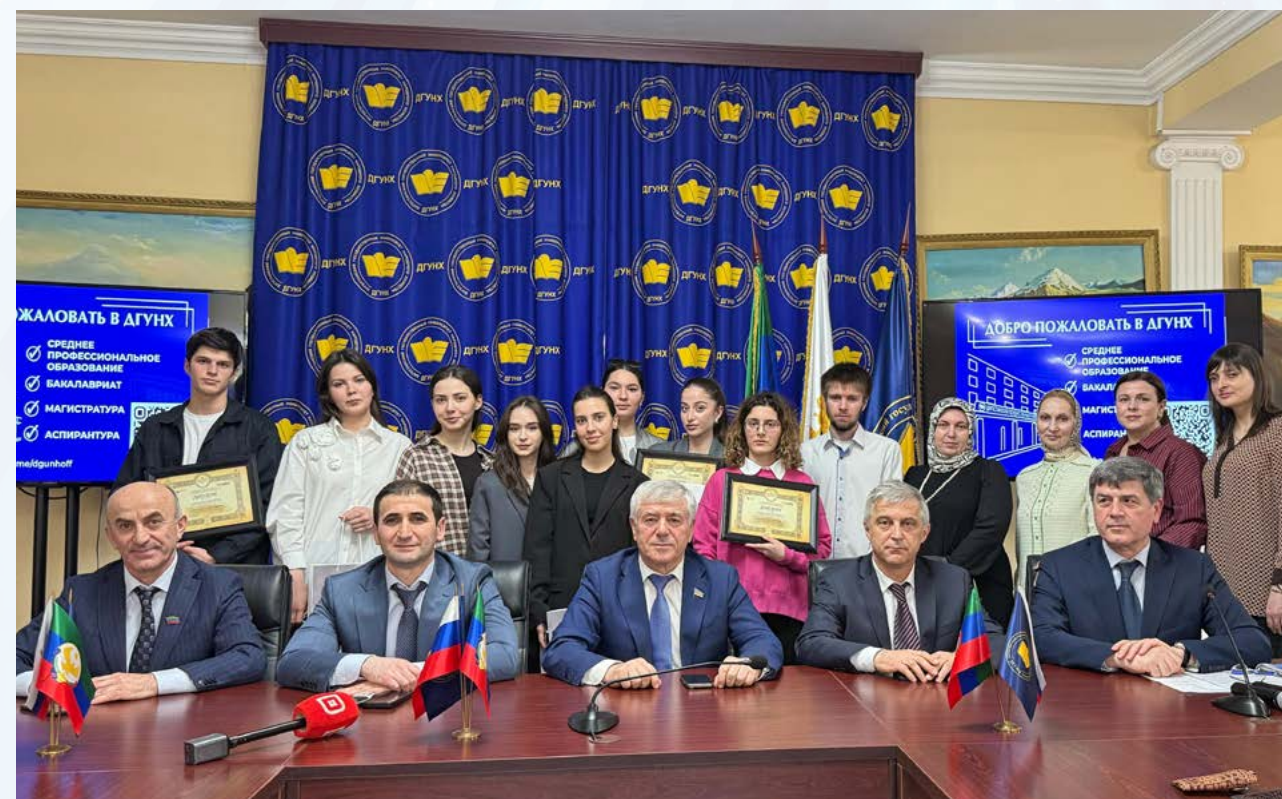
Церемония награждения победителей XI Всероссийской олимпиады по истории предпринимательства