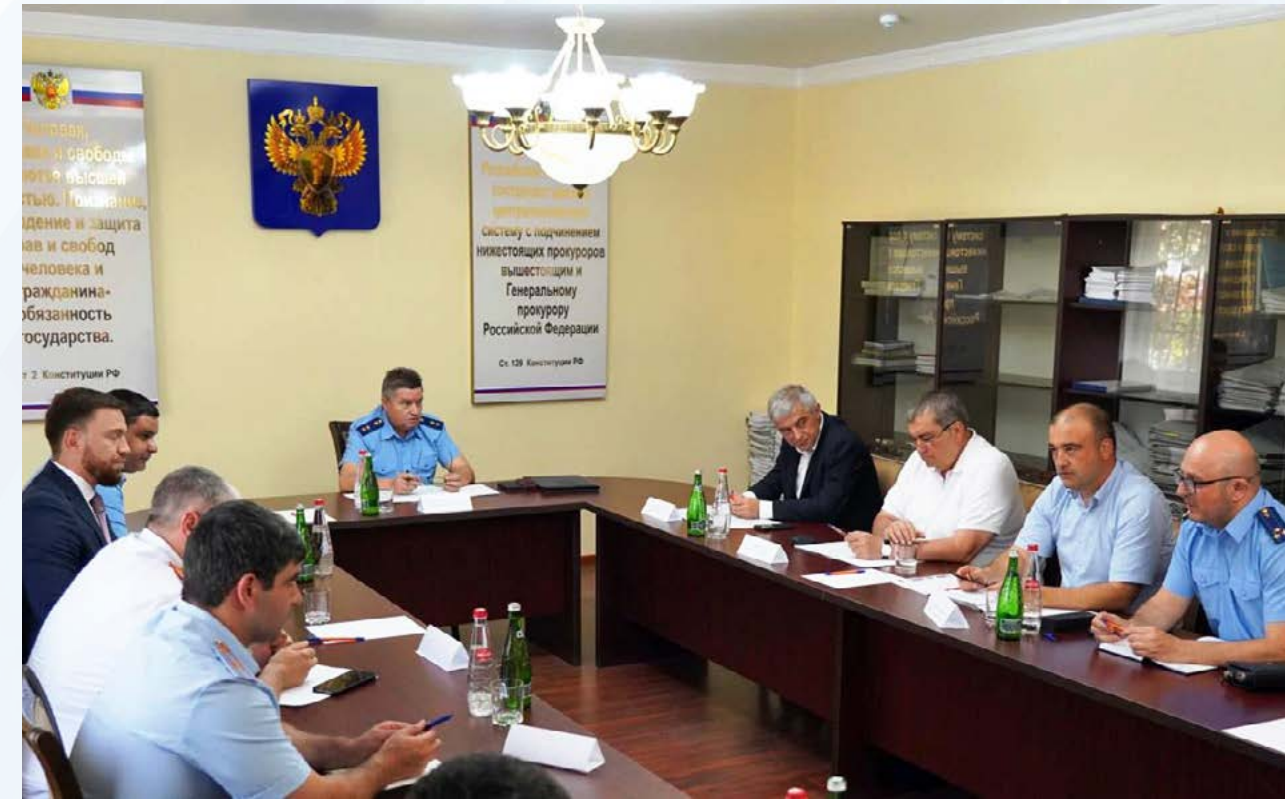
В Дербенте и Дербентском районе состоялся прием предпринимателей